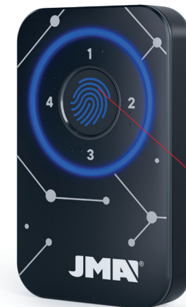
Fingerprint Lector de huella