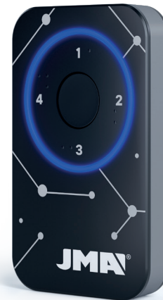
\ M-BT Advance

Los nuevos telemandos M-BT Advance y Biometric se adaptan a los nuevos parámetros de seguridad, ofreciendo mayor alcance de funcionamiento, así como un nuevo diseño con lectura de braille.